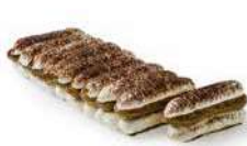
BANDA TIRAMISÚ SAVOIARDI