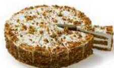
TARTA AMERICANA CARROT CAKE