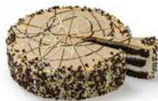
TARTA CHOCO AVELLANA