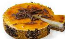
TARTA SAN MARCOS