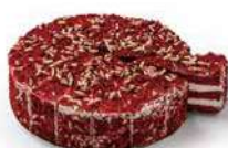
TARTA AMERICANA RED VELVET