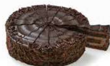
TARTA AMERICANA MUERTE POR CHOCOLATE